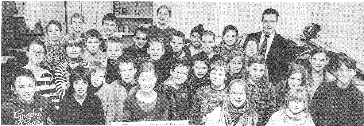
Die Realschulklasse 6d hat ihren Verkaufserlös vom Hühumer Weihnachtsmarkt einem guten Zweck zur Verfügung gestellt. Die Volksbank stockte den Betrag noch einmal auf.